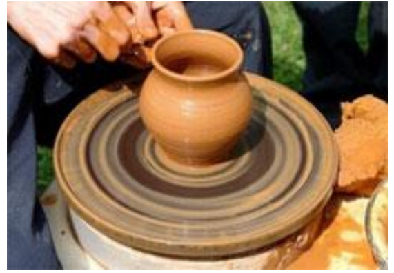
Гончар виготовляє глечик

Вихователь запрошує дітей сісти та послухати казочку про маленький шматочок глини. Розповідь супроводжується показом слайдів.